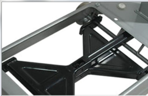
▲ Design Double V-Shape